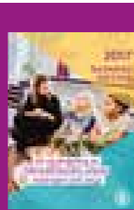
Sammantaget synliggör utvärderingen att Barnrättsbyråns koncept fungerar: att kämpa tillsammans med barnen med en blandning av kompetens och mycket hjärta. Barnrättsbyrån fyller ett behov för utsatta barn och ungdomar, som i takt med rådande samhällsutveckling, bara kommer att öka.

Utvärderingen visar att Barnrättsbyrån alltid arbetar utifrån det uppdragsgivande barnet med olika typer av rättighetsproblematik, helt beroende på den unges behov och utsatthet. Under 2017 ville de flesta barn och unga ha hjälp med socialtjänsten, bostad, skola eller migrationsrättsliga problem. Fyra femtedelar av Barnrättsbyråns barn bor utan sina vårdnadshavare, antingen inom samhällets försorg eller utan eget boende, till exempel hos vänner. Två tredjedelar av Barnrättsbyråns barn har kommit till Sverige på flykt som ensamkommande barn och de flesta har dari som modersmål. Därefter är vanliga modersmål svenska, persiska och somali.